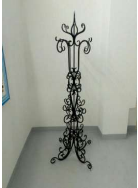
Сабақ барысында Ковка техникасында өз фантазиямызбен жасалған киім ілгіш