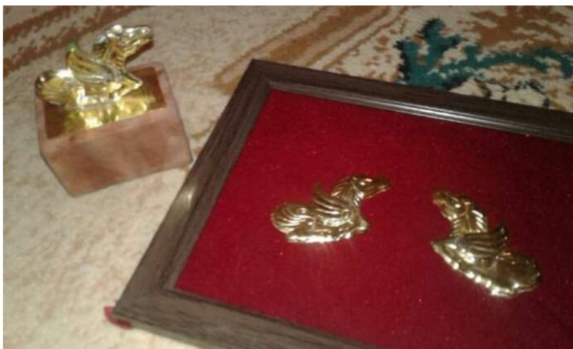
Сақ стиліне келтіріп жасалған стилизацияланған ат мүсіні